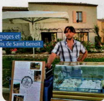
Le chevrier, ses fromages et le marché des Jardins de Saint-Benoit.