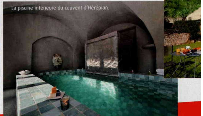
La piscine intérieure du couvent d'Hérépian.