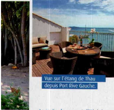
Vue sur l'étang de Thau depuis Port Rive Gauche.

L'esprit cathare, vous le découvrirez en grim pant sur les forteresses que sont les châteaux de Quéribus et de Peyrepertuse, deux musts! Quant au «fou chantant», il est né à Narbonne. La cité, coupée par le canal de la Robine et dotée d'un marché couvert Belle Epoque, possède de beaux monuments comme le palais des archevêques, la cathédrale et la basilique. Les jours de mariage, on s'y bouscule!