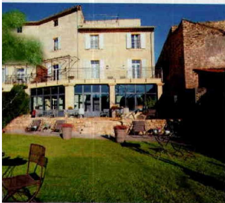
Le jardin du couvent d'Hérépien.